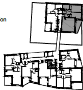
Plan de Situation NIVEAU 2

NOTA : La surface des placards est incluse dans celle des pièces attenantes